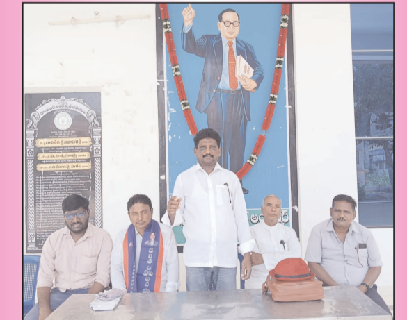
(షణ్ముఖ వెలుగు, ఒంగోలు, జూన్ 2)