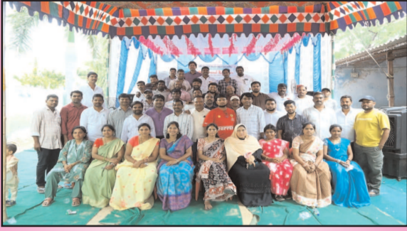
(షణ్ముఖ వెలుగు, కంభం, జూన్ 2)