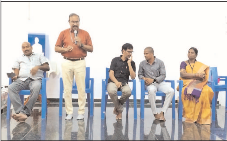
(షణ్ముఖ వెలుగు, ఒంగోలు, జూన్ 2)