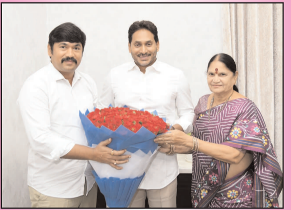
(షణ్ముఖ వెలుగు, ఒంగోలు, జూన్ 2)