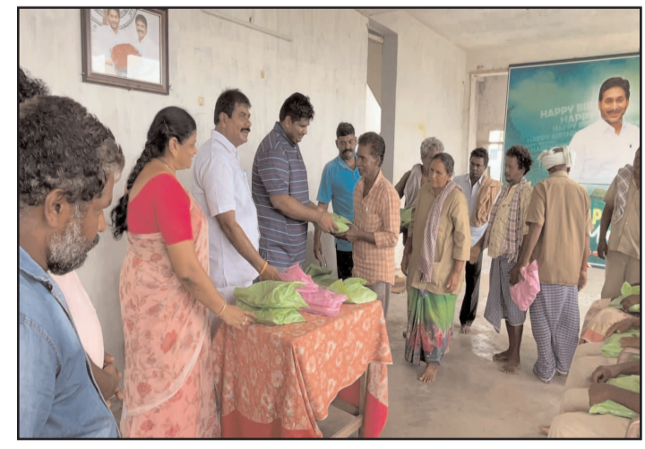
(షణ్ముఖ వెలుగు, ఉలవపాడు, జూన్ 1) కర్రేడు గ్రామానికి నిరంతరం సేవలందిస్తున్న పారిశుధ్య కార్మికులను గౌరవించాలని ఉద్దేశంతో 23 మంది పారిశుధ్య కార్మికులకు చీరల పంపిణీ చేయడం అయినదని వైయస్సార్ టీచర్స్