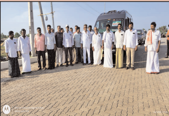
(షణ్ముఖ వెలుగు, పొన్నలూరు, జూన్ 1)