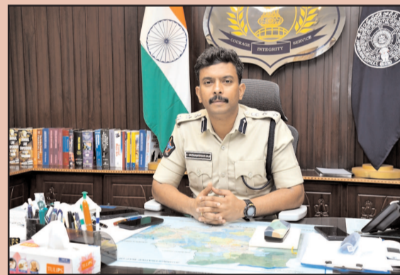
(షణ్ముఖ వెలుగు, ఒంగోలు, మే 29)