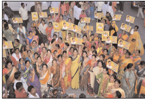
(షణ్ముఖ వెలుగు, ఒంగోలు, మే 29)