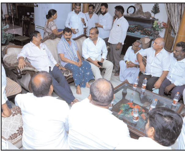
యలమంద నివాసానికి చేరుకుని యలమందను పరామర్శించి ధైర్యం చెప్పారు. ఇలా జరగడం దురదృష్టకరమని, అందరూ ధైర్యంగా ఉండాలన్నారు.

ఇటీవల ఆమె కుమారుడు వివాహం అనంతరం చేసుకున్న మొక్కుబడిలో భాగంగా తమ కుటుంబ సభ్యులతో కలిసి బద్రినాథ్, కేదార్ నాథ్ తీర్థయాత్రలకు కొద్ది రోజుల క్రితం బయలుదేరారు. అయితే ఆమె బద్రినాథ్ యాత్ర ముగించుకుని కేదార్ నాథ్ వెళ్లే ప్రకారంలో ఆక్సిజన్ అందక ఆమె తీవ్ర ఇబ్బంది పడ్డారు. దీంతో వెంట ఉన్న బంధుమిత్రులు స్పందించి ఆమెను రుద్ర ప్రయాగ హాస్పిటల్ కు తీసుకొని వెళ్లే లోపే మార్గమధ్యంలో ఆమె మృతి చెందారు. సమాచారం అందుకున్న ఇంటి వద్ద ఉన్న ఆమె భర్త డిడిపి నాయకులు ఒక్కసారిగా పాకికు గురై తీవ్ర కలత చెందారు. మాజీ జెడ్పీటిసి మరణ వార్త తెలుసుకున్న మండల, పట్టణానికి చెందిన పార్టీలకు అతీతంగా నాయకులు దిగ్భ్రాంతికి లోనే ఆవులూరి యలమందను పరామర్శించారు. ఈమె 2001 నుండి 2006 వరకు తెలుగుదేశం పార్టీ తరఫున పొదిలి మండల జెడ్పీటిసిగా ఎన్నికయ్యారు. ఆమెకు ఒక కుమారుడు, ఇద్దరు కుమార్తెలు ఉన్నారు.