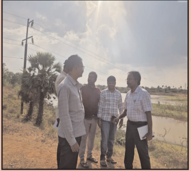
(షణ్ముఖ వెలుగు, ఒంగోలు, మే 26) పిడుగుపాటు మరణంగా పోలీసులు చెబుతున్న వూసూరు కొండయ్య అనే యానాది యువకుడిది హత్యే నని ఎస్సీ కులానికి చెందిన కొండయ్య హత్యపై దర్శి డిఎస్పి చే

తగ్గించి వినియోగదారులకు మెరుగైన సేవలు అందించేందుకు ఈ పనులు కీలకమని తెలిపారు. పనులను వేగవంతంగా పూర్తి చేసి, భద్రతా ప్రమాణాలను కచ్చితంగా పాటించాలని అధికారులకు ఆదేశించారు. పనుల పురోగతి, సాంకేతిక అంశాల పై అధికారులను అడిగి తెలుసుకుని, అవసరమైన సూచనలు చేశారు. ఈ కార్యక్రమంలో సంబంధిత ఇంజనీర్లు, విద్యుత్ శాఖ అధికారులు పాల్గొన్నారు.