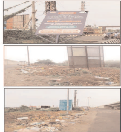
(షణ్ముఖ వెలుగు, కొంభాపూడి, మే 26)

వేదవేదాల్లోని పురాణ సెంటర్ లోపు అక్షరాలతో కొంతమంది దానిని అక్షరాలతో వేయడంతో ఆ మార్గం వెళ్లడంతో వచ్చింది. దానిని వేయడంలో ఆ మార్గం వెళ్లడంతో వచ్చింది. వేదవేదాల్లోని పురాణ సెంటర్ లోపు అక్షరాలతో కొంతమంది దానిని అక్షరాలతో వేయడంతో ఆ మార్గం వెళ్లడంతో వచ్చింది. వేదవేదాల్లోని పురాణ సెంటర్ లోపు అక్షరాలతో కొంతమంది దానిని అక్షరాలతో వేయడంతో ఆ మార్గం వెళ్లడంతో వచ్చింది.