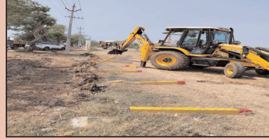
(షణ్ముఖ వెలుగు, ఒంగోలు, మే 26)