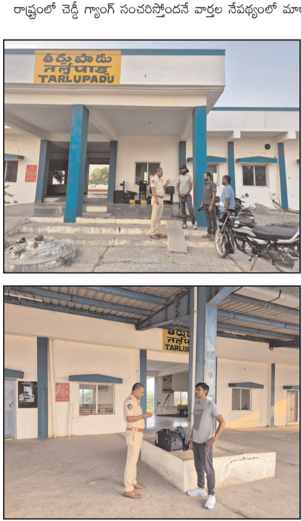
(షణ్ముఖ వెలుగు, తర్లపాడు, మే 23)