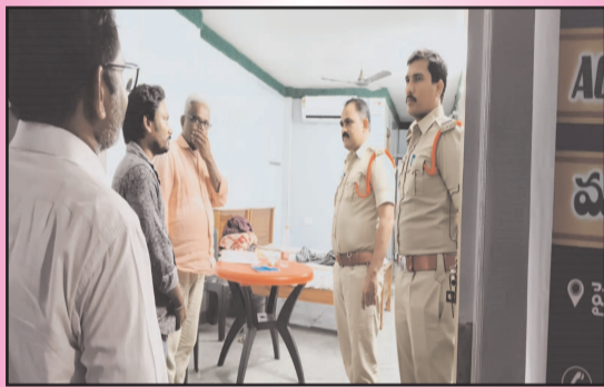
(షణ్ముఖ వెలుగు, కంభం, మే 23)