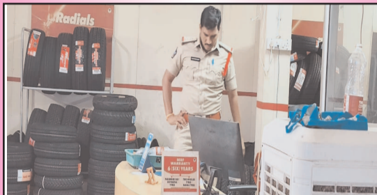
(షణ్ముఖ వెలుగు, కంభం, మే 23)

మార్కెట్లో జిల్లా కంభం పట్టణంలోని వై జెంక్షన్ సమీపంలో ఉన్న ఎంఆర్ఎఫ్ ట్రై షాపులో నిన్న రాత్రి చోరీ ఘటన చోటుచేసుకుంది. గుర్తుతెలియని దుండగులు షాపు షట్టర్ తాళాలు పగులగొట్టి లోపలికి ప్రవేశించారు. పోరామోలోని క్యాష్ డెస్లో ఉంచిన రూ.50,000 నగదును అవహరించినట్లు సమాచారం. అంతేకాకుండా షాపులో ఏర్పాటు చేసిన సీసీ కెమెరాలను ధ్వంసం చేసి, వాటికి సంబంధించిన స్టోరేజ్ డివైస్, చిప్స్ కూడా తీసుకెళ్లినట్లు తెలిసింది. ఈ ఘటనపై కేసు నమోదు చేసిన కంభం పోలీసులు దర్యాప్తు చేపట్టారు. ఘటనాస్థలాన్ని పరిశీలించిన పోలీసులు ఆధారాలు సేకరిస్తున్నారు. ఈ కేసును కంభం ఎస్ఐబి శివ కృష్ణారెడ్డి పర్యవేక్షిస్తున్నారు.