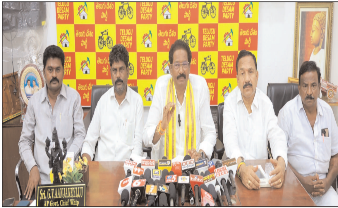
(షణ్ముఖ వెలుగు, వినుకొండ, మే 23)