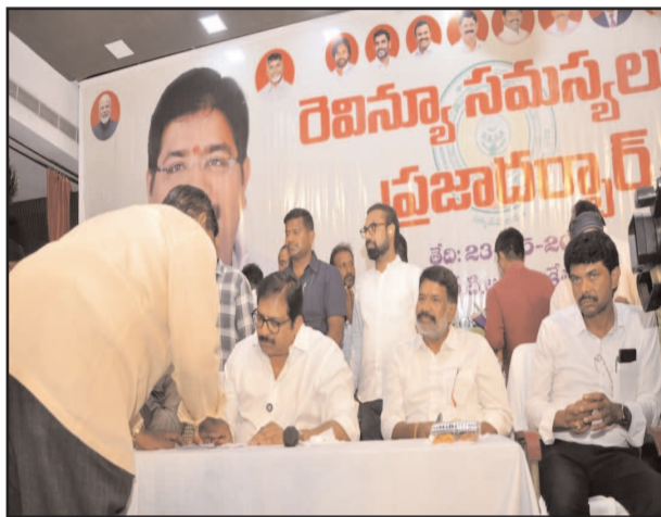
(షణ్ముఖ వెలుగు, ఒంగోలు, మే 23)

ఒంగోలు అర్బన్ రూరల్ ప్రాంత ప్రజల రెవెన్యూ సమస్యలను త్వరితగతిన పరిష్కారం చేసేందుకు ప్రజా దర్బార్ నిర్వహించడం జరిగిందని ఎమ్మెల్యే దామచర్ల జనార్దన్ రావు అన్నారు. నగరంలోని ఆర్డీవో కార్యాలయ ప్రాంగణంలో జరిగిన ప్రజా దర్బార్ కి సుమారు 300 మంది వారి యొక్క సమస్యలను ఎమ్మెల్యేతో పాటు అధికారుల దృష్టికి తీసుకువచ్చారు. ఈ సందర్భంగా దామచర్ల జనార్దన్ రావు మాట్లాడుతూ ప్రజా దర్బార్ నిర్వహించడం వలన ప్రజల సమస్యలు తెలుసుకొని అధికారులు అక్కడికక్కడే పరిష్కార మార్గాలతో పాటు ఇంకా ఏదైనా సమస్య ఉంటే ఎంత సమయంలో పరిష్కారానికి అవకాశం ఉంది అనే తెలుసుకొని దానికోసం ఈ కార్యక్రమం బాగా ఉపయోగపడుతుందని అన్నారు. ప్రధానంగా ఇళ్ల స్థలాల సమస్యలు, ఇంటి పట్టాల సమస్యలు, భూ సమస్యలు, స్థలాల సమస్యలు ఎక్కువగా వచ్చాయని వాటిని ఎప్పుడు లో గా పరిష్కారం చేస్తామని అనేది కూడా కంప్యూటర్లో సమాధులు చేసి నేరుగా కాలే సెంటర్ ద్వారా సమాచారం అందిస్తామని తెలిపారు. కొంతమంది నివాసం ఉంచుకొని ఇల్లు కట్టుకోవడానికి వీలు లేక ఇబ్బందులు పడుతున్నారని వారికి నివేషి స్థలాలకు పొజిషన్ సర్టిఫికేట్లు అందించడం జరిగిందని ఇంకా కొన్ని పొజిషన్ సర్టిఫికేట్లు ఇచ్చేందుకు తయారు చేశామని తెలిపారు. గత ఐదు సంవత్సరాలు కాలంలో భూ రికార్డులు తొలగించారని, డబల్ రిజిస్ట్రేషన్ జరిగాయని అలాంటివన్నీ కూడా ఇద్దరి