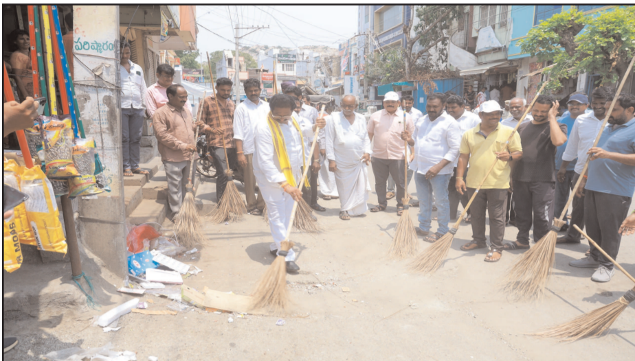
(షణ్ముఖ వెలుగు, వినుకొండ, మే 23)