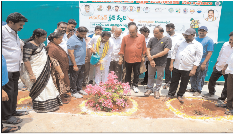
వారం వ్యాపార సముదాయాలపై ఘన వ్యర్థాల నిర్వహణ నిబంధనల అమలు, జరిమానాల

రాష్ట్ర ప్రభుత్వం, స్వచ్ఛాంధ్ర కార్పొరేషన్ సంయుక్త ఆధ్వర్యంలో ప్రతి నెలా మూడో శనివారం నిర్వహించే 'సానా' (స్వచ్ఛాంధ్ర - స్వచ్ఛాంధ్ర) కార్యక్రమంలో భాగంగా పట్టణాలు, నగరాలను సంపూర్ణ చెత్త రహిత ప్రాంతాలుగా మార్చేందుకు అత్యంత ప్రతిష్టాత్మకంగా చేపట్టిన 'ఆపరేషన్ క్లీన్ స్వీప్' వినుకొండలో ఘనంగా ప్రారంభమైంది. ఈ పారిశుధ్య మహోద్యమంలో ప్రభుత్వ చీఫ్ జీవీ ఆంజనేయులు స్వయంగా పాల్గొన్నారు. చీపురు పట్టి వీధులను శుభ్రం చేయడంతో పాటు మొక్కలకు నీరు పోసి ప్రజా చైతన్యాన్ని రగిల్చారు. ఈ సందర్భంగా ఆయన మాట్లాడుతూ.. ముఖ్యమంత్రి నారా చంద్రబాబు నాయుడు విజన్ తో రాష్ట్ర రూపురేఖలు మారుతున్నాయని, స్వచ్ఛ ఆంధ్ర కార్యక్రమం ద్వారా దేశంలోనే ఆంధ్రప్రదేశ్ ను అగ్రస్థానంలో నిలపడమే ధ్యేయంగా పనిచేస్తున్నామని ప్రకటించారు. పరిసరాల పరిశుభ్రతతోనే ప్రజల ఆరోగ్యానికి శ్రీకారం చుట్టవచ్చని హితవు పలికారు. గత వైసీపీ ప్రభుత్వం టన్నుల కొద్దీ వ్యర్థాలను పేరుకుపోయేలా చేసి, చెత్త మీద పన్నులు వేసిన ఒక 'చెత్త ప్రభుత్వం' అని ఆయన తీవ్రంగా విమర్శించారు. స్వచ్ఛమైన వినుకొండ సాధన కోసం ప్రజలంతా భాగస్వాములు కావాలని పిలుపునిచ్చారు. రాబోయే 4 వారాల పాటు సాగే ఈ ప్రత్యేక కార్యచరణ ప్రణాళికలో మొదటి వారం సమస్యల గుర్తింపు-క్లీనింగ్, రెండో వారం డ్రైనేజీల పూడికతీత, మూడో