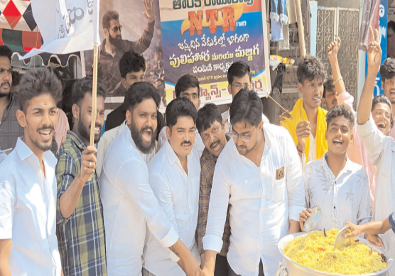
(షణ్ముఖ వెలుగు, మాచర్ల టౌన్, మే 20)