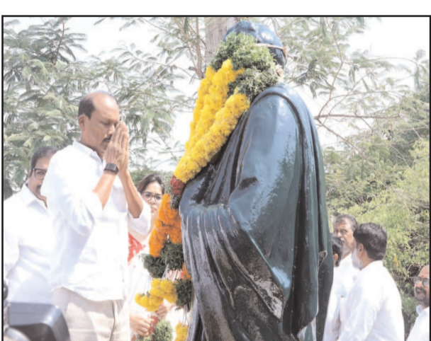
(షణ్ముఖ వెలుగు, విజయవాడ, మే 20)

పవర్ పెట్రోల్ కొనడానికి సుముఖంగా లేరన్నారు. ఫలితంగా డీలర్లు విలువైన వినియోగదారులను కోల్పోతున్నారని తెలిపారు. వారు క్రమంగా పోలీసుల దృష్టికి అవుట్లెట్లకు మారుతున్నారని చెప్పారు. ఇది హెచ్పిసిఎల్ డీలర్ల వ్యాపార మనుగడ, వినియోగదారులను నిలుపుకోవడం పై గణనీయంగా ప్రభావం చూపుతోందన్నారు. ఈ విషయాలను దృష్టిలో ఉంచుకుని స్థానిక మార్కెట్ డిమాండ్, వినియోగదారుల ప్రాధాన్యతకు విరుద్ధంగా పవర్ పెట్రోల్ను తీసుకోవాలని డీలర్లను బలవంతం చేయవద్దని సంబంధిత అధికారులకు తగిన ఆదేశాలు జారీ చేయాలని అభ్యర్థిస్తున్నామన్నారు. నిజమైన అమ్మకాల సామర్థ్యం, వినియోగదారుల ఆమోదం ఆధారంగా పనిచేయాలని డీలర్లను అనుమతించాలని కోరారు. డీలర్ల ప్రయోజనాలను పరిరక్షించడానికి, ఆంధ్రప్రదేశ్ వ్యాప్తంగా ఆరోగ్యకరమైన వ్యాపార కార్యకలాపాలను కొనసాగించడానికి తక్షణ చర్యలు తీసుకోవాలని కోరారు.