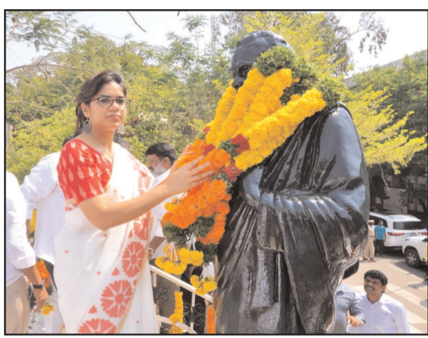
(షణ్ముఖ వెలుగు, విజయవాడ, మే 20)

పవర్ పెట్రోల్ కొనడానికి సుముఖంగా లేరన్నారు. ఫలితంగా డీలర్లు విలువైన వినియోగదారులను కోల్పోతున్నారని తెలిపారు. వారు క్రమంగా పోలీసుల దృష్టికి అవుట్లెట్లకు మారుతున్నారని చెప్పారు. ఇది హెచ్పిసిఎల్ డీలర్ల వ్యాపార మనుగడ, వినియోగదారులను నిలుపుకోవడం పై గణనీయంగా ప్రభావం చూపుతోందన్నారు. ఈ విషయాలను దృష్టిలో ఉంచుకుని స్థానిక మార్కెట్ డిమాండ్, వినియోగదారుల ప్రాధాన్యతకు విరుద్ధంగా పవర్ పెట్రోల్ను తీసుకోవాలని డీలర్లను బలవంతం చేయవద్దని సంబంధిత అధికారులకు తగిన ఆదేశాలు జారీ చేయాలని అభ్యర్థిస్తున్నామన్నారు. నిజమైన అమ్మకాల సామర్థ్యం, వినియోగదారుల ఆమోదం ఆధారంగా పనిచేయాలని డీలర్లను అనుమతించాలని కోరారు. డీలర్ల ప్రయోజనాలను పరిరక్షించడానికి, ఆంధ్రప్రదేశ్ వ్యాప్తంగా ఆరోగ్యకరమైన వ్యాపార కార్యకలాపాలను కొనసాగించడానికి తక్షణ చర్యలు తీసుకోవాలని కోరారు.