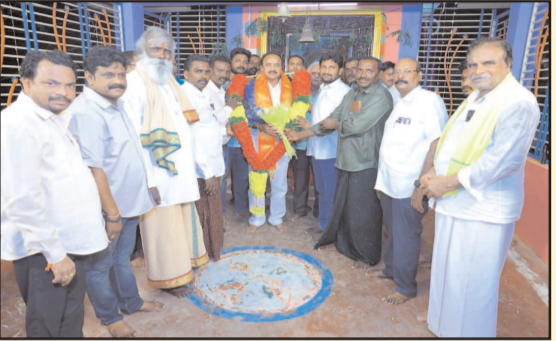
(షణ్ముఖ వెలుగు, చీరాల, మే 20)