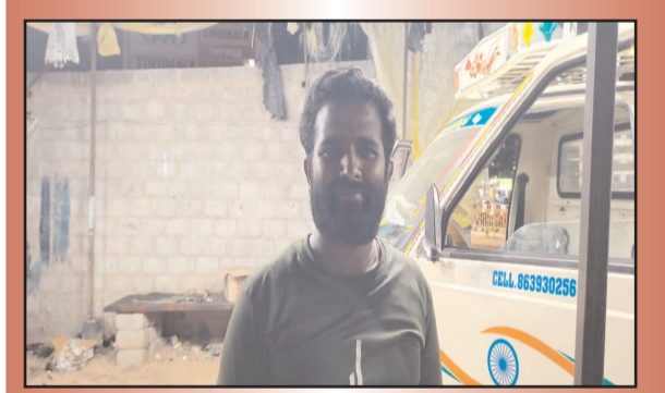
(షణ్ముఖ వెలుగు, కంభం, మే 14)

కంభం పట్టణంలోని బస్టాండ్ సమీప స్టాల్ లాడ్స్ ఏరియాలో వీధి కుక్కలు బీభత్సం సృష్టించాయి. రోడ్డుపై వెళ్తున్న ఓ వ్యక్తిపై మరోకోట ఇద్దరిపై ఒక్కసారిగా కుక్కలు దాడి చేయడంతో కాలిపై తీవ్ర గాయాలు అయ్యాయి. దాడిలో బాధితుడి కాలికి గాట్లు పడటంతో స్థానికులు వెంటనే స్పందించి అతడిని చికిత్స నిమిత్తం ఆస్పత్రికి తరలించారు. సంఘటనతో ఆ ప్రాంత ప్రజలు భయాందోళనకు గురయ్యారు. ముఖ్యంగా రాత్రి సమయంలో, బస్టాండ్ పరిసరాల్లో వీధి కుక్కల సంచారం ఎక్కువైందని స్థానికులు ఆవేదన వ్యక్తం చేస్తున్నారు. ఇప్పటికైనా మున్సిపల్ అధికారులు స్పందించి వీధి కుక్కల నియంత్రణ చర్యలు చేపట్టాలని ప్రజలు డిమాండ్ చేస్తున్నారు. బస్టాండ్, లాడ్స్ ప్రాంతాల్లో తరచూ ప్రయాణికులు రాకపోకలు సాగించే నేపథ్యంలో వెంటనే ప్రత్యేక చర్యలు తీసుకోవాలని స్థానిక ప్రజలు కోరుతున్నారు.