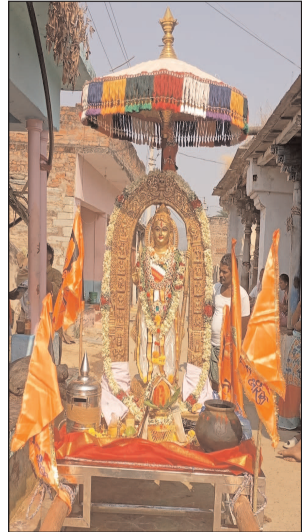
(షణ్ముఖ వెలుగు, బద్వేల్, మే 14)

మున్సిపాలిటీ పరిధిలో గురువారం సాయంకాలం శ్రీ అయోధ్య బాల రాముని నూతన విగ్రహం శోభాయాత్ర కార్యక్రమం నాలుగు గంటల సుండి కోటవీధి రామాలయం సుండి ప్రారంభమై బద్వేల్ నాలుగు రోడ్ల కూడలి మీదుగా సిద్ధపటం రోడ్డు సుండి తెలుగు గంగ కాలనీలో నూతనంగా వెలిసిన కోదండ రామస్వామి దేవాలయమునకు శోభాయాత్ర కార్యక్రమాన్ని కనుల పండుగగా నిర్వహించారు. బాల రామునికి బద్వేల్ పట్టణంలో ఆడుగుడుగున భక్తాదులందరూ మంచినీరు వారు పోసి కాయ కర్పూరం సమర్పించుకొని భక్తులు తమ భక్తిని చాటుకున్నారు. స్వామివారి వెంబడి జైశ్రీరామ్ జైశ్రీరామ్ అంటూ స్వామివారి నామస్మరణతో మారుమోగింది. పలువురు మహిళలు స్వామివారి కలశములతో జైశ్రీరామ్ అంటూ ఖాళీ స్థాయిలో పాల్గొని స్వామివారి శోభాయాత్ర కార్యక్రమాన్ని జయప్రదం చేశారు. మార్చి 28, తారీఖున బాలరామని శోభాయాత్ర