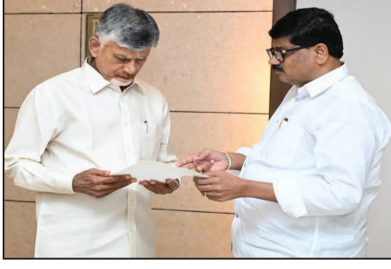
(షణ్ముఖ వెలుగు, బడ్జెట్, మే 14)