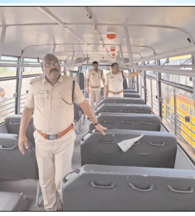
(షణ్ముఖ వెలుగు, ఒంగోలు, మే 14)

అనుభవములు కలిగి 60 సంవత్సరముల లోపల వున్న వ్యక్తులను డ్రైవర్లుగా నియమించాలన్నారు. ఫిట్నెస్ సర్టిఫికేట్ ఏబిఎస్ వద్ద నుండి పొందిన తర్వాత ప్రతి బస్సును ఉప రవాణా కమిషనర్ వారి కార్యాలయం, ఒంగోలు, దర్శి, కందుకూరు నందు వాహన తనిఖీ అధికారుల ఎదుట హాజరు పరిచి స్కూల్, కాలేజీ బస్సులు ఏబిఎస్ 63 నిబంధనలు అన్ని కూడా అమర్చి ఉన్నాయా లేదా అని పరిశీలించుట హాజరు పెట్టవలెను. ఇప్పటివరకు ఈ నెల 28.04.2026 నుండి 14.05.2026 వరకు 47 స్కూల్, కాలేజీ యాజమాన్యాలు 250 స్కూల్, కాలేజీ బస్సులను ఏబిఎస్ 63 నార్మ్ ప్రకారం తనిఖీలు చేయడం జరిగింది. 250 వెహికల్స్ ఏబిఎస్ 63 నార్మ్, అన్ని తనిఖీ చేయగా అందులో 137 బస్సులకు ఏబిఎస్-63 నిబంధనల ప్రకారం ఉన్నాయి. 113 బస్సులను తిరిగి ఏబిఎస్ 63 నిబంధనల ప్రకారము సరి చేసుకోవలసిందిగా కోరుతూ వెనక్కి తిప్పి పంపడం జరిగినది. ప్రతి రోజు స్కూల్, కాలేజీ బస్సుల యాజమాన్యం వారి బస్సులకు ఫిట్నెస్ కొరకు ఏ టి ఎస్ సెంటర్ నందు ఫిట్నెస్ చేయించుకొని ఉప రవాణా కమిషనర్ వారి కార్యాలయము నందు మరల ఆ కాలేజీ బస్సులను వాహన తనిఖీ అధికారుల ఎదుట హాజరు పరచాల్సిందిగా కోరారు. నిబంధనలకు అనుగుణంగా లేని యెడల వాహనములు సీజ్ చేయబడును కనుక ప్రతి స్కూల్, కాలేజీ బస్సుల యాజమాన్యం తప్పనిసలుగా నిబంధనలు పాటించి స్కూల్, కాలేజీ ప్రారంభించేలోగా సవీకరణ చేసుకోవాలని కోరారు.