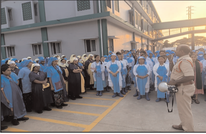
(షణ్ముఖ వెలుగు, సింగరాయకొండ, మే 14)