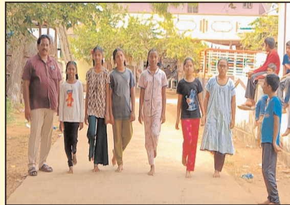
(షణ్ముఖ వెలుగు, ఉలవపాడు, మే 14)

మండల కేంద్రమైన ఉలవపాడు శాఖ గ్రంథాలయంలో వేసవి విజ్ఞాన తరగతుల్లో భాగంగా గురువారం విద్యార్థులతో ముందుగా సీతీ కథలు జాతీయ నాయకుల జీవిత చరిత్రలు మొదలగు పుస్తకాలు చదివించి అనంతరం పిల్లల్లో దాగి ఉన్న సృజనాత్మక శక్తిని వెలికితీసే క్రమంలో వారికి లి కుందుడు గుమ్మ లి అనే ఆటను ఆడిపించడం జరిగినది. అనంతరం పిల్లలకు స్టాక్స్ అందించడం జరిగింది. కొంత మంది తల్లిదండ్రులు వారి పిల్లలను వెంటపెట్టుకొని గ్రంథాలయం వద్ద వదిలివెళ్లడం చాలా ఆనందంగా ఉంది. వారికి గ్రంథ పాలకుడు వృద్ధయ పూర్వక ధన్యవాదాలు తెలిపారు. ఈ కార్యక్రమానికి మొత్తం 41 మంది విద్యార్థులు హాజరైనట్లు గ్రంథాలయ పాలకుడు డి కోటేశ్వరరావు తెలియజేశారు.