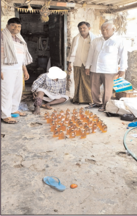
(షణ్ముఖ వెలుగు, కొండపి, మే 3)