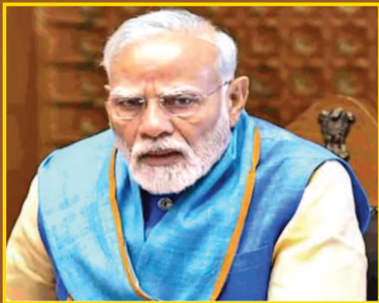
(షణ్ముఖ వెలుగు, ఢిల్లీ, మే 03)