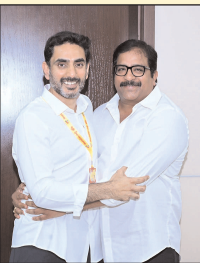
(షణ్ముఖ వెలుగు, ఒంగోలు, ఏప్రిల్ 29) మంగళగిరి రాష్ట్ర పార్టీ కార్యాలయంలో జాతీయ, రాష్ట్ర కార్యవర్గాల ప్రమాణ స్వీకారమహోత్సవ కార్యక్రమంలో ఉమ్మడి ప్రకాశం జిల్లా ప్రజా ప్రతినిధులతో కలిసి టిడిపి