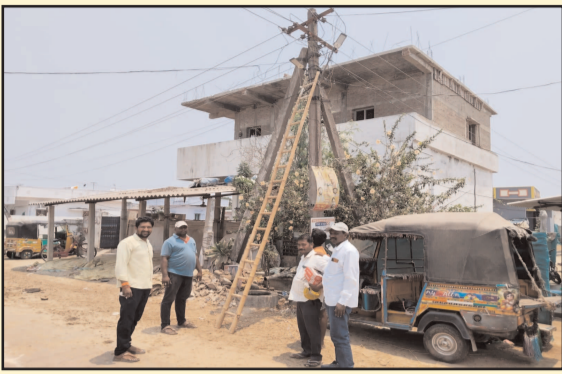
(షణ్ముఖ వెలుగు, వేటపాలెం, ఏప్రిల్ 29)