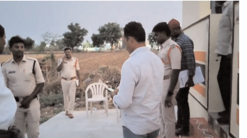
(షణ్ముఖ వెలుగు, పెద్దారవీడు, ఏప్రిల్ 29)