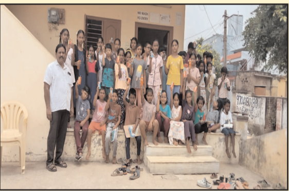
(షణ్ముఖ వెలుగు, ఉలవపాడు, ఏప్రిల్ 29)