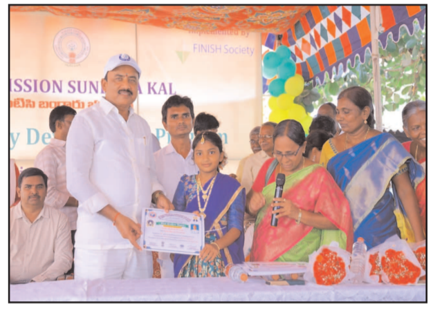
(షణ్ముఖ వెలుగు, చీరాల, ఏప్రిల్ 25)