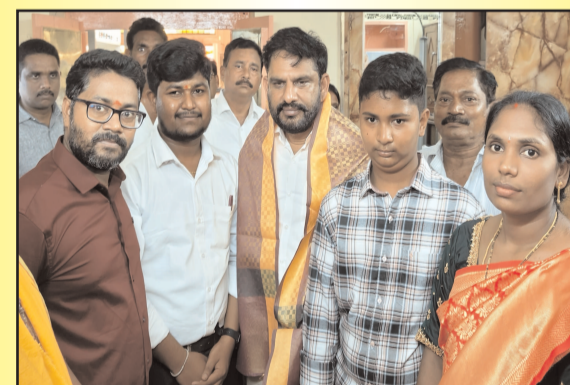
(షణ్ముఖ వెలుగు, చిలకలూరిపేట, ఏప్రిల్ 25)