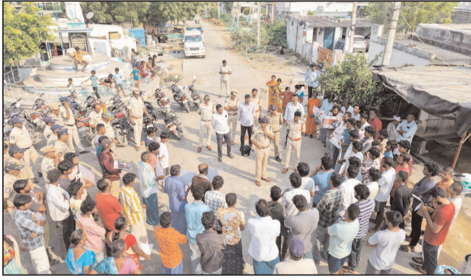
ఇ (షణ్ముఖ వెలుగు, ఒంగోలు, ఏప్రిల్ 25)

మాదక ద్రవ్యాల నిర్మూలన, శాంతి భద్రతల పరిరక్షణ, నేరాల నియంత్రణ, అసాంఘిక కార్యకలాపాల కట్టడిని లక్ష్యంగా చేసుకుని ప్రకాశం జిల్లా ఎస్పీ వి హర్షవర్ధన్ రాజు ఆదేశాల మేరకు ఒంగోలు డిఎస్పీ ఆర్ శ్రీనివాసరావు ఆధ్వర్యంలో చీమకుర్తి సీబి డి.ప్రసాద్, ఒంగోలు సబ్ డివిజన్ 5 మంది ఎస్ఐలు, 40 మంది పోలీస్ సిబ్బంది, ఈగల్ సిబ్బంది బృందాలుగా ఏర్పడి చీమకుర్తిలోని గరికపట్ట ప్రాంతంలో, పరిసర ప్రాంతాల్లో శనివారం ఉదయం 'అపరేషన్ వజ్రా ప్రహారీ'లో భాగంగా కార్డన్ ౬ సెర్చ్ ఆపరేషన్ నిర్వహించారు. ఈ సెర్చ్ లో భాగంగా గంజాయి మరియు ఇతర మాదక ద్రవ్యాల నిల్వ, విక్రయాలపై ప్రత్యేక దృష్టి సారీస్తూ ఇళ్లు, దుకాణాలు, పాత ముద్రాయిల నివాసాల్లో సోదాలు నిర్వహించారు. కొత్త వ్యక్తులు యొక్క వివరాలను సేకరించారు. సరైన పత్రాలు లేని 30 బైక్ లు, 3 ఆటో లు స్వాధీనం చేసుకొని పోలీస్ స్టేషన్ కు తరలించారు. ఈ సందర్భంగా ఒంగోలు డిఎస్పీ రామపాటి శ్రీనివాసరావు గారు మాట్లాడుతూ ప్రజలు, గ్రామీణ కార్యకర్తలు గంజాయి సహా అన్ని రకాల మాదకద్రవ్యాలకు దూరంగా ఉండాలని సూచించారు. మాదకద్రవ్యాలకు బానిసైతే వ్యక్తి