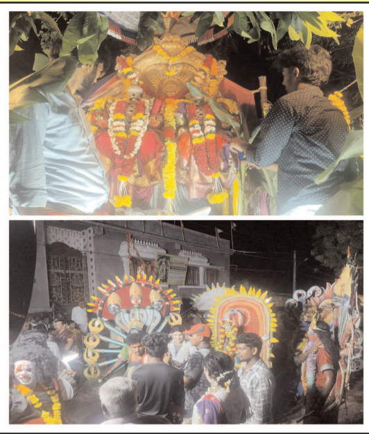
(షణ్ముఖ వెలుగు, తర్కపాడు, ఏప్రిల్ 25)

స్థానిక తర్కపాడు గ్రామంలో వెలసిన శ్రీ పోతులూరి వీరబ్రహ్మేంద్ర స్వామి వారి ఆరాధన వేడుకలు అత్యంత భక్తిశ్రద్ధలతో, ఘనంగా నిర్వహించారు. ఈ సందర్భంగా గ్రామంలో ఆధ్యాత్మిక వాతావరణం నెలకొంది. ఉత్సాహాన్ని భాగంగా స్వామివారి కళ్యాణ మహోత్సవాన్ని అర్చకులు శాస్త్రోక్తంగా నిర్వహించారు. రంగురంగుల పుష్పాలతో అలంకరించిన వేదికపై స్వామివారు, అమృతాన్ని కళ్యాణాన్ని తిలకించేందుకు భక్తులు భారీగా తరలివచ్చారు. మంగళవాయిద్యాలు, వేద మంత్రోచ్ఛారణల మధ్య జరిగిన ఈ వేడుక భక్తులకు కనువిందు చేసింది. కళ్యాణం అనంతరం భక్తులందరికీ అన్న ప్రసాదకార్యక్రమం నిర్వహించారు. గ్రామం మరియు చుట్టుపక్కల ప్రాంతాల నుండి వచ్చిన వందలాది మంది భక్తులు స్వామివారిని దర్శించుకుని ప్రసాదాన్ని స్వీకరించారు. సాయంత్రం వేళ విగ్రహ మూర్తులతో గ్రామోత్సవం నిర్వహించారు. అలంకరించిన వాహనంపై స్వామివారిని ఊరేగిస్తూ గ్రామ వీధుల గుండా ఊరేగింపు సాగింది. భక్తులు అడుగుడుగునా హారతులు ఇచ్చి స్వామి వారిని దర్శించుకున్నారు.