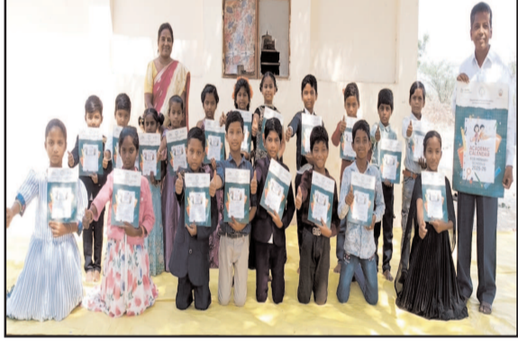
(షణ్ముఖ వెలుగు, తర్లపాడు, ఏప్రిల్ 23)