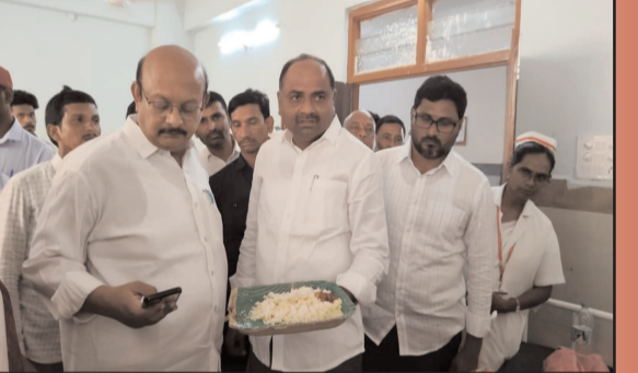
(షణ్ముఖ వెలుగు, యర్రగండపాలెం, ఏప్రిల్ 23)

స్థానిక ప్రభుత్వ ఏరియా ఆసుపత్రిని నియోజకవర్గ ఎమ్మెల్యే తాటిపర్తి చంద్రశేఖర్ ఆకస్మికంగా తనిఖీ చేశారు. ఆసుపత్రిలో రోగులకు అందుతున్న వైద్య సేవలు, ఇతర సౌకర్యాలను ఆయన స్వయంగా పరిశీలించారు. రోగులకు వడ్డీనున్న భోజనాన్ని దగ్గరుండి పరిశీలించిన ఆయన, దాని నాణ్యతపై అసహనం వ్యక్తం చేశారు. భోజనం ప్లేటును చేత్తో పట్టుకుని, నాణ్యత లేని ఆహారాన్ని వడ్డీపై ఉరుకునేది లేదని హెచ్చరించారు. ఆహారం విషయంలో నిర్లక్ష్యం వహించిన అధికారులను, సంబంధిత కాంట్రాక్టర్లను ఆయన ప్రశ్నించారు. రోగులకు మెరుగైన, పోషక విలువలనున్న ఆహారాన్ని అందించాలని ఆదేశించారు. ఆసుపత్రిలోని వార్డులను సందర్శించి, రోగులతో మాట్లాడి వారికి అందుతున్న చికిత్స గురించి అడిగి తెలుసుకున్నారు. మందుల కొరత లేకుండా చూడాలని డాక్టర్లకు సూచించారు. ప్రభుత్వ ఆసుపత్రికి వచ్చే పేద రోగులకు మెరుగైన వైద్యంతో పాటు నాణ్యమైన ఆహారం అందించడం బాధ్యత. ఇందులో ఎటువంటి నిర్లక్ష్యాన్ని సహించబోమన్నారు. ఆసుపత్రి పరిసరాలను శుభ్రంగా ఉంచాలని, సిబ్బంది సమయపాటన పాటించాలని ఆయన ఈ సందర్భంగా అధికారులకు స్పష్టం చేశారు.