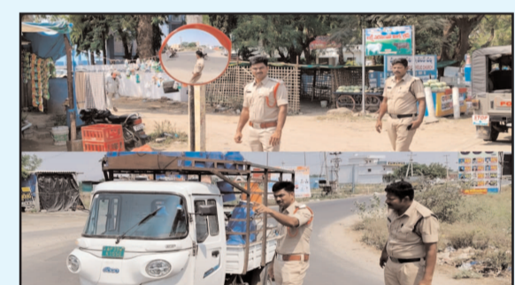
(షణ్ముఖ వెలుగు, పొదిలి, ఏప్రిల్ 23)