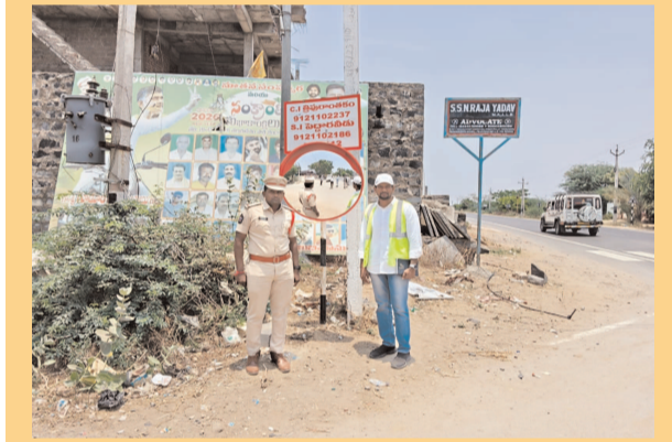
(షణ్ముఖ వెలుగు, పెద్దారవీడు, ఏప్రిల్ 23)