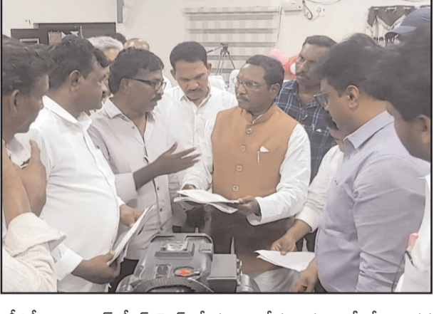
(షణ్ముఖ వెలుగు, ఒంగోలు, ఏప్రిల్ 23)