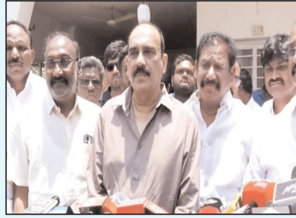
(షణ్ముఖ వెలుగు, ఒంగోలు, ఏప్రిల్ 23)

రాష్ట్ర ఉప ముఖ్యమంత్రి, జనసేన పార్టీ అధినేత పవన్ కళ్యాణ్ ఆరోగ్యం నిలకడగా ఉందని రాష్ట్ర మాజీ మంత్రి, జనసేన పార్టీ నాయకులు బాలినేని శ్రీనివాసారెడ్డి పేర్కొన్నారు. గురువారం ఆయన ఒంగోలులోని తన నివాసానికి హైదరాబాదు నుండి విచ్చేశారు. ఈ సందర్భంగా ఆయన మీడియాతో మాట్లాడుతూ రాష్ట్రవ్యాప్తంగా పవన్ కళ్యాణ్ ఆరోగ్యం బాగుండాలని, ఆయన త్వరగా కోలుకొని ప్రజాసేవలో పునరంకితం కావాలని కార్యకర్తలు, ప్రజలు దేవాలయాలలో ప్రత్యేక పూజలు నిర్వహించారు అన్నారు. రాష్ట్రవ్యాప్తంగా పవన్ కళ్యాణ్ కు లక్షలాది అభిమానులు ఉన్నారన్నారు. వారందరి ఆశీస్సులతో పవన్ కళ్యాణ్ ఆరోగ్యం త్వరగా కుదుటపడుతుందని బాలినేని పేర్కొన్నారు.