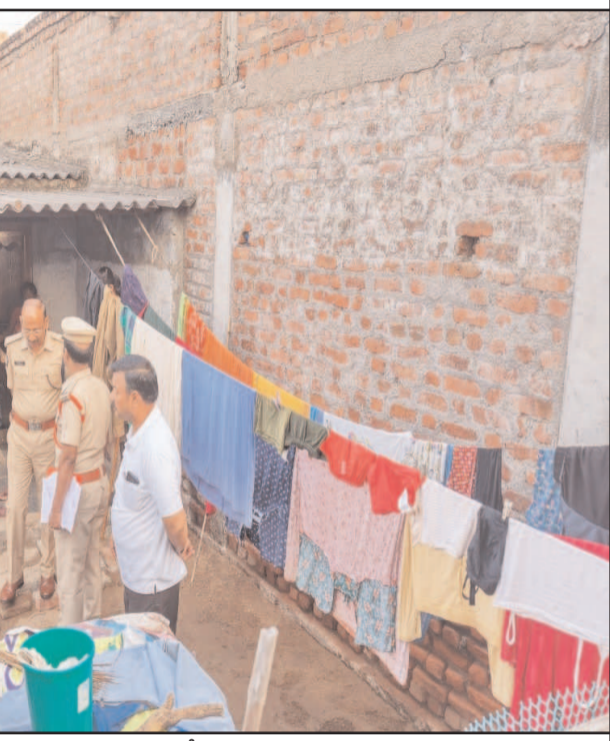
నిర్వహించి ప్రజలతో కలిసి "మత్తుకు దూరంగా ఉండాలి-మత్తు లేని సమాజాన్ని నిర్మిద్దాం" అనే ప్రతిజ్ఞ చేయించారు. గంజాయి వంటి మాదకద్రవ్యాలు సమాచారం ఉంటే వెంటనే స్థానిక పోలీసులు లేదా డయల్ 112 లేదా పోలీస్ వాట్సాప్ నెంబర్ 9121102266 తెలియజేయాలని ప్రజలను కోరారు.

పదార్థాలకు దూరంగా ఉండాలన్నారు. మత్తు పదార్థాలు అక్రమ రవాణా, విక్రయదారులపై చట్టపరమైన చర్యలు తీసుకుంటామని తెలియజేశారు. రోడ్డు ప్రమాదాల నివారణకు ప్రతి వాహనదారుడు తప్పనిసరిగా హెల్మెట్ ధరించాలని, అతివేగం, మైనర్ డ్రైవింగ్, మద్యం సేవించి వాహనాలు నడపకూడదని సూచించారు. సైబర్ నేరాలపై అప్రమత్తంగా ఉండాలని, అపరిచితుల కాల్స్కు స్పందించి ఓటీపీలు చెప్పవద్దని హెచ్చరించారు. అలాగే ఆన్లైన్ గేమ్స్, బెట్టింగ్లకు దూరంగా ఉండాలని, ఆధార్ వివరాలను అపరిచితులతో పంచుకోవద్దని తెలిపారు. తక్కువ సమయంలో ఎక్కువ డబ్బులు వస్తాయని చెప్పే మోసగాళ్లను సమ్యుక్తంగా జాగ్రత్తగా ఉండాలని సూచించారు. ఈ సందర్భంగా ర్యాలీ