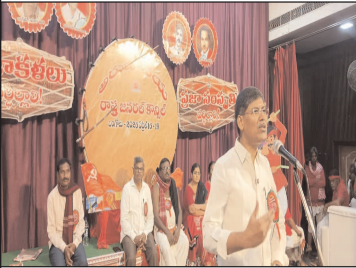
(షణ్ముఖ వెలుగు, ఒంగోలు, ఏప్రిల్ 19)