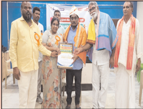
(షణ్ముఖ వెలుగు, మార్చి 19)

సేవా రంగంలో మరో మైలురాయి సేవతో సత్తా చాటిన పిన్నిక శివ స్ఫూర్తి ప్రదాత అవార్డు 2026 సొంతం