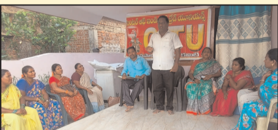
(షణ్ముఖ వెలుగు, ఉలవపాడు, ఏప్రిల్ 9)