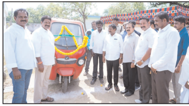
(షణ్ముఖ వెలుగు, టంగుటూరు, ఏప్రిల్ 2)