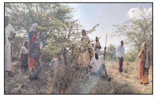
పెద్ద ఎత్తున చేపడుతున్నారు. ఉదయం 6 గంటల నుండి మధ్యాహ్నం వరకు పనిచేస్తున్నారు. పని ప్రదేశం మూడు నుంచి ఐదు కిలోమీటర్లు ప్రయాణిస్తారు. అక్కడ నీడ(టెంటు) ప్రధాన చికిత్స కిట్లు కరువయ్యాయి. ఉపాధి కూలీలు చెబు నీడలో నీడ తీరటం చేస్తున్నారు. ఇకనైనా సంబంధించిన అధికారులు పట్టించుకోని ఉపాధి కూలీలకు కనీస వసతులు కల్పించాలని వారు కోరుతున్నారు.