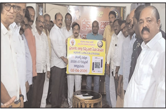
(షణ్ముఖ వెలుగు, ఒంగోలు, ఏప్రిల్ 2)