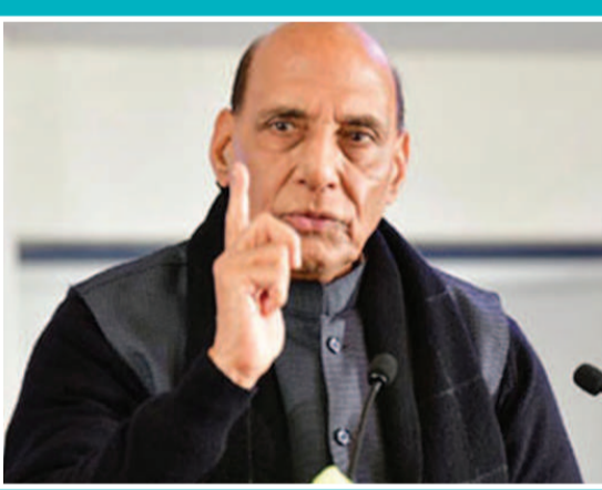
(షణ్ముఖ వెలుగు, ఢిల్లీ, ఏప్రిల్ 02)

ఇరాన్ యుద్ధం నేపథ్యంలో పాకిస్థాన్ ను భారత రక్షణ మంత్రి రాజ్ నాథ్ వరేక్షంగా హెచ్చరించారు. ప్రస్తుత పరిస్థితులను అసరాగా చేసుకొని పొరుగుదేశం ఏదైనా దున్నాహాసానికి పాల్పడితే ప్రతిస్పందన తీవ్రంగా ఉంటుందన్నారు. కేరళలోని తిరువనంతపురంలో ఏర్పాటు చేసిన ఓ కార్యక్రమంలో మాట్లాడిన ఆయన.. ఉగ్ర చర్యలపై గతంలో దీటుగా బదులిచ్చిన విషయాన్ని గుర్తుచేశారు. గత ఏడాది ఏప్రిల్లో పహల్గాం ఉగ్రదాడి జరిగింది. ఈ దాడి జరిగి ఏడాది పూర్తవుతున్న వేళ రాజ్ నాథ్ ఈ వ్యాఖ్యలు చేయడం గమనార్హం. "ప్రస్తుత పరిస్థితుల్లో మన పొరుగు దేశం ఏదైనా కవ్వంపు చర్యలకు పాల్పడవచ్చు. ఒకవేళ అదే జరిగితే.. భారత ప్రతిస్పందన ఊహించని రీతిలో, నిర్ణయాత్మకంగా ఉంటుంది. ఉరి నెక్కార్ దాడి తర్వాత జరిపిన చర్యకల్ (స్ట్రెక్స్), పుల్వామా తర్వాత వైమానిక దాడులు, పహల్గాం దాడుల అనంతరం ఆపరేషన్ సిందూర్.. ఇలా ఉగ్రవాద చర్యలపై భారత్ తీవ్రంగా స్పందించింది" అని రాజ్ నాథ్ పేర్కొన్నారు. ఆంధ్రప్రదేశ్ పునర్విభజన చట్టసవరణ బిల్లుకు రాజ్యసభలోనూ ఆమోదం లభించింది. మూజువాణి ఓటుతో బిల్లుకు రాజ్యసభ ఆమోదం తెలిపింది. అంతకుముందు ▶ మిగతా 2లో