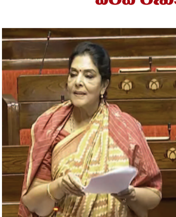
(షణ్ముఖ వెలుగు, అమరావతి, ఏప్రిల్ 02)

అమరావతికి చట్టబద్ధత బిల్లు రాజ్యసభలో ప్రవేశపెట్టడం ఆ ప్రాంత రైతుల విజయమని కాంగ్రెస్ ఎంపీ రేణుకా చౌదరి అన్నారు. బిల్లుపై నిర్వహించిన చర్చలో ఆమె మాట్లాడారు. "ఏపీ రాజధానిపై 12 ఏళ్లుగా అస్పష్టత ఉంది. దీంతో పెట్టుబడులు వెనక్కి వెళ్లాయి. గత సీఎం ▶ మిగతా 2లో