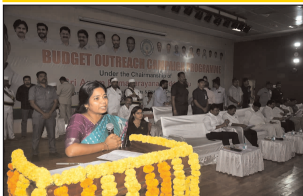
అని చెప్పారు. రాష్ట్ర ప్రభుత్వం బడ్జెట్లో ప్రకాశం జిల్లా కోసం 4 వేల 200 కోట్ల రూపాయలు మార్కాపురం జిల్లాకు 2 వేల 725 కోట్ల రూపాయలు కేటాయించడం జరిగిందని ఆమె చెప్పారు. రాష్ట్ర ప్రభుత్వం జిల్లాలు, మండలాల అవసరాలను దృష్టిలో పెట్టుకొని బడ్జెట్ కేటాయించడం జరుగుతుందని ఆమె చెప్పారు. ప్రభుత్వం బడ్జెట్లో సంక్షేమ, అభివృద్ధి పథకాలకు, సూపర్ సిక్స్ కార్యక్రమాలను అమలు చేయడానికి నిధులు ఖర్చు చేస్తుందని