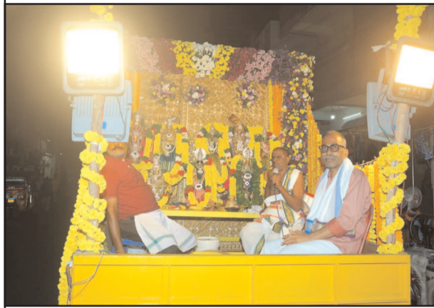
(షణ్ముఖ వెలుగు, చీమకుర్తి, ఏప్రిల్ 2)