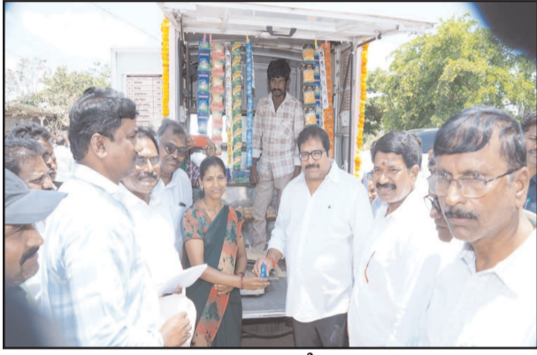
(షణ్ముఖ వెలుగు, ఒంగోలు, ఏప్రిల్ 2)