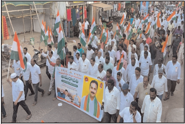
(షణ్ముఖ వెలుగు, కందుకూరు, ఏప్రిల్ 2)

ఎన్టీఆర్ సర్కిల్ నుంచి అంబేద్కర్ విగ్రహం వరకు ఉత్సవ ర్యాలీ మార్చోగిన జై అమరావతి నినాదం