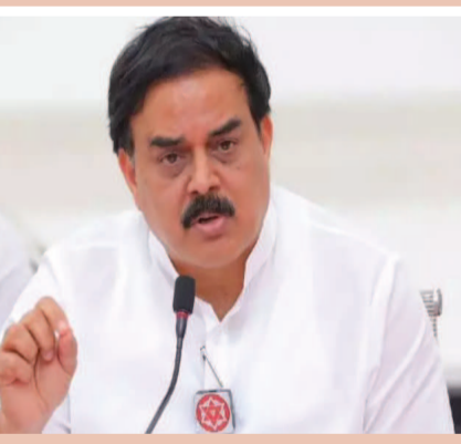
(షణ్ముఖ వెలుగు, అమరావతి, ఏప్రిల్ 02)