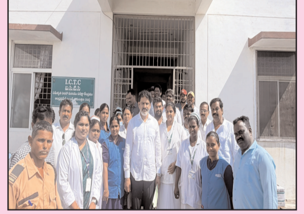
(షణ్ముఖ వెలుగు, పర్చూరు, ఏప్రిల్ 2)