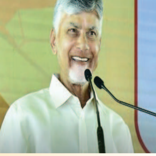
(షణ్ముఖ వెలుగు, అమరావతి, ఏప్రిల్ 02)

ఆంధ్రప్రదేశ్ జీవనాడి పోలవరం ప్రాజెక్టును పూర్తి చేయాలన్న ప్రభుత్వ సంకల్పంలో నేడు మరో కీలక ఘట్టం పూర్తయిందని ఆంధ్రప్రదేశ్ ముఖ్యమంత్రి నారా చంద్రబాబునాయుడు 'ఎక్స్ వేదికగా ట్వీట్ చేశారు. ప్రాజెక్టు నిర్మాణంలో అత్యంత కీలకమైన 1,372 మీటర్ల పొడవైన 'డయాఫ్రం వాల్' నిర్మాణాన్ని ఇరిగేషన్ శాఖ తక్కువ సమయంలో పూర్తి చేసింది ప్రశంసించారు. ఇందుకు ఇరిగేషన్ శాఖ అధికారులకు, ఇంజనీర్లకు ఆయన అభినందనలు తెలిపారు. దీనికి సహకరించిన కేంద్ర సంస్థలకు, పోలవరం ప్రాజెక్టు అథారిటీ ప్రతినిధులకు ఆయన ధన్యవాదాలు తెలిపారు. గత పాలకుల నిర్లక్ష్యం కారణంగా డి-వాల్ దెబ్బతిందంతో అదనంగా రూ.1000 కోట్లు వెచ్చించి నిర్మించామని పేర్కొన్నారు. డయాఫ్రమ్ వాల్ పూర్తి కావడంతో ప్రధాన కట్టడమైన ఎర్త్ కమ్ రాక్ ఫిల్ (ఈసీఆర్ఎఫ్) ద్వారా పనులు వేగవంతమవుతాయని అన్నారు. ఇప్పటికే ప్రకటించినట్లు అన్ని పనులు పూర్తిచేసి 2027 పుష్కరాలకు ముందే పోలవరం ప్రాజెక్టును పూర్తి చేసి జాతికి అంకితమిస్తామని పునరుద్ఘాటించారు.