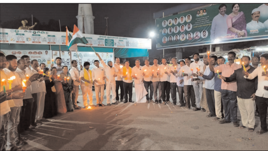
(షణ్ముఖ వెలుగు, పొదిలి, ఏప్రిల్ 2)