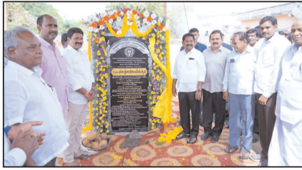
(షణ్ముఖ వెలుగు, టంగుటూరు, ఏప్రిల్ 2)