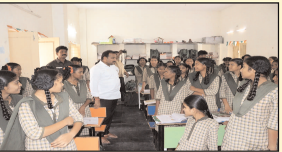
(షణ్ముఖ వెలుగు, వలేటివారిపాలెం, మార్చి 31)