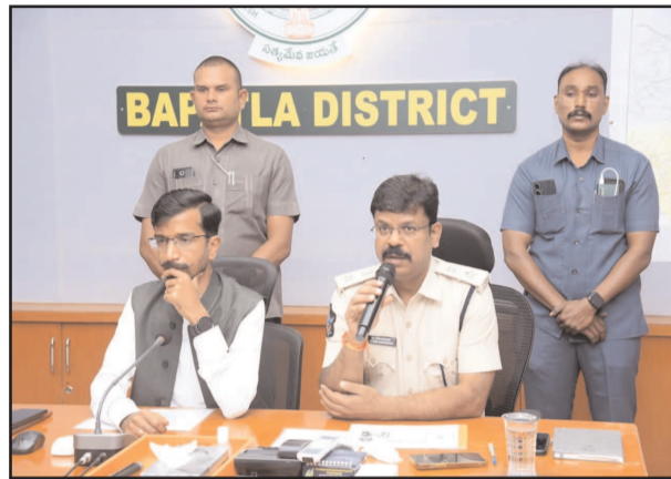
(షణ్ముఖ వెలుగు స్టాఫ్ రిపోర్టర్, బాపట్ల, మార్చి 31)