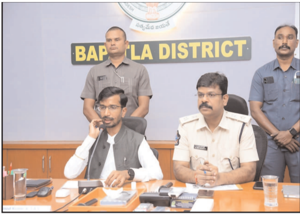
(షణ్ముఖ వెలుగు స్టాఫ్ రిపోర్టర్, బాపట్ల, మార్చి 31)