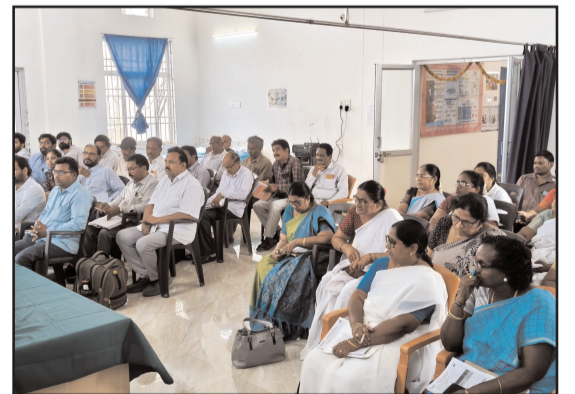
(షణ్ముఖ వెలుగు, అద్దంకి, మార్చి 31)