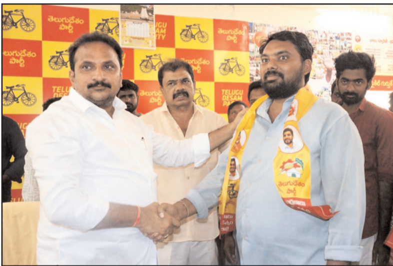
(షణ్ముఖ వెలుగు, ఉలవపాడు, మార్చి 31)

కందువాలు కప్పి పార్టీలోకి ఆహ్వానించిన ఎమ్మెల్యే ఇంటూరి