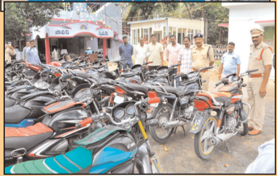
(షణ్ముఖ వెలుగు, ఒంగోలు, మార్చి 31)

వివిధ ప్రాంతాలలో వాహన దొంగతనాలకు పాల్పడుతున్న వ్యక్తిని అరెస్టు చేసి అతని వద్ద నుంచి 27 ద్విచక్ర వాహనాలు, 1.75 కేజీ గంజాయి పట్టుకొని మొత్తం విలువ 10 లక్షల రూపాయలు సొత్తును స్వాధీనం చేసుకున్నామని ఒంగోలు డిఎస్పీ రాధాపాటి శ్రీనివాసరావు అన్నారు. ఒకటో పట్టణ పోలీస్ స్టేషన్లో మంగళవారం జరిగిన మీడియా సమావేశంలో ఆయన మాట్లాడుతూ కొత్తపట్నం మండలం పాదర్ల గ్రామానికి చెందిన ఏడుకొండలు అనే వ్యక్తిని జిల్లాలోనూ అటు గుంటూరు జిల్లాలోనూ అనేక చోట్ల మోటార్ సైకిళ్ళు దొంగతనాలు చేస్తూ ఆ వాహనాలను వేరే వ్యక్తులకు అమ్మి సొమ్ము చేసుకుంటున్నారని అన్నారు. సోమవారం ఒకటో పట్టణ పోలీస్ స్టేషన్లో శోధన చేస్తుండగా ముద్దాయి పోలీసులు చూసి పారిపోతుండగా అతనిని అరెస్ట్ చేసి విచారించగా దొంగతనం చేసిన విషయాలను వివరించారని అన్నారు. మొత్తం 27 వాహనాలు ఉన్నాయని వాహనాలు పోయిన వారు ఎవరైనా ఒకటో పట్టణ పోలీస్ స్టేషన్ సంప్రదించి వారి యొక్క వాహనాలు వ్రత్రాలు తీసుకొని వచ్చి తెలియజేయాలని అన్నారు. సీసీ కెమెరాలు బిగించుకోవడం వలన చాలా ప్రయోజనాలు ఉన్నాయని అన్నారు. సీసీ కెమెరాలు బిగించినందువలన ఇటీవల రెండు పెద్ద దొంగతనాలు కేసులు చేజిందం జరిగిందని గుర్తు చేశారు. అందువలన ప్రతి ఒక్కరూ సీసీ కెమెరాలు బిగించుకొని మీ ఇంట్లోని విలువైన సొత్తును కాపాడుకోవాలని అన్నారు. దొంగతనం కేసును చేదించిన పట్టణ పట్టణ పోలీసులను ఎస్పీ హర్షవర్ధన్ రాజు అభినందించినట్లు ఆయన తెలిపారు. సమావేశంలో ఒకటవ పట్టణ ఇన్స్పెక్టర్ వై నాగరాజు, ఏఎస్ఐ సురేష్, ఎం సాయి, జి విజయ్, కానిస్టేబుల్ ఎం అనిల్, సిబ్బంది పాల్గొన్నారు.