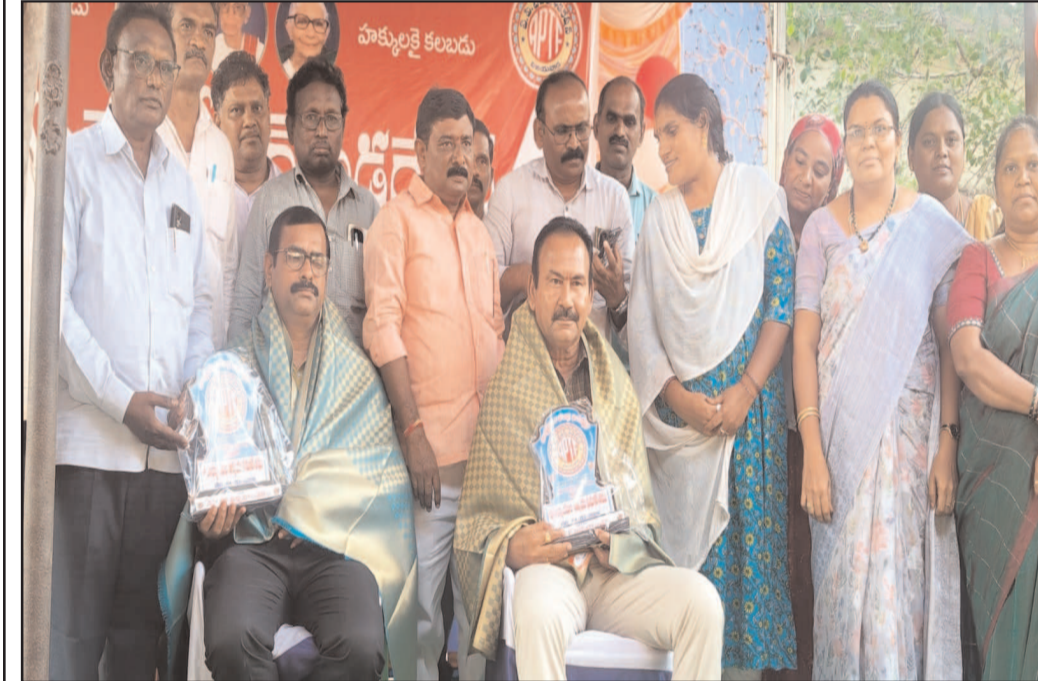
(షణ్ముఖ వెలుగు, త్రిపురాంతకం, మార్చి 24)