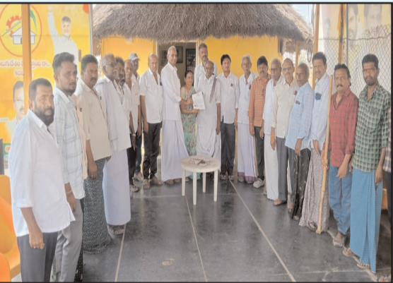
(షణ్ముఖ వెలుగు, పర్రూరు, మార్చి 24)