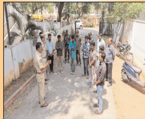
(షణ్ముఖ వెలుగు, ఒంగోలు, మార్చి 21)