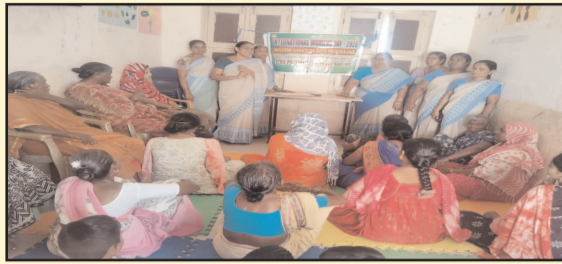
(షణ్ముఖ వెలుగు, పుల్లలచెరువు, మార్చి 16)

పుల్లలచెరువు ఎస్సీ సెంటర్లో అంతర్జాతీయ మహిళా దినోత్సవ వేడుకలు