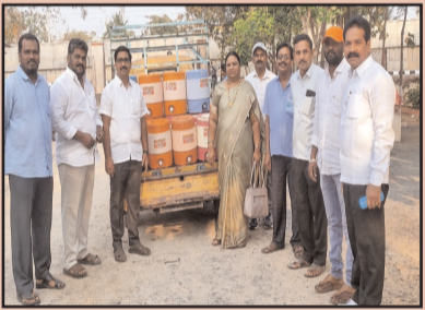
(షణ్ముఖ వెలుగు, కంభం, మార్చి 16)