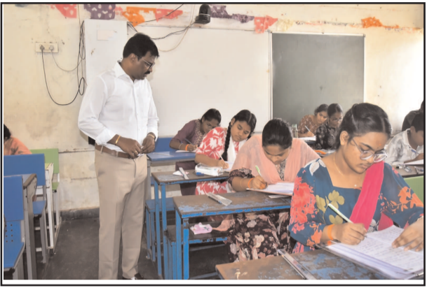
(షణ్ముఖ వెలుగు స్టాఫ్ రిపోర్టర్, ఒంగోలు, మార్చి 16)