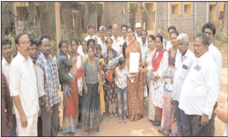
(షణ్ముఖ వెలుగు, స్టాఫ్ రిపోర్టర్, ఒంగోలు, మార్చి 16)