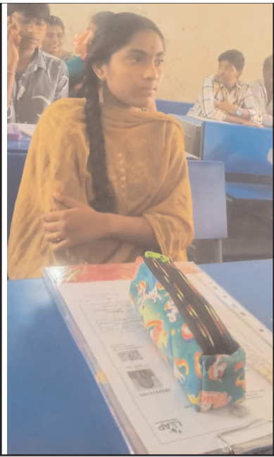
(షణ్ముఖ వెలుగు, ఒంగోలు, మార్చి 16) ఉమ్మడి ప్రకాశం జిల్లాలో పదవ తరగతి పబ్లిక్ పరీక్షలు ప్రారంభమైనాయి. ఈనెల 31వ తేదీ వరకు పరీక్షలు జరగనున్నాయి. రెగ్యులర్, ప్రైవేట్ కలిపి మొత్తం 28632 మంది విద్యార్థులు పరీక్షలు రాస్తున్నారు. వీరిలో బాలురు 14310 మంది, బాలికలు 14322 మంది ఉన్నారు. వీరికోసం జిల్లాలో 165 పరీక్షా కేంద్రాలను ఏర్పాటు చేశారు. ఉదయం 9.30 నుండి మధ్యాహ్నం 12.45 గంటల వరకు పరీక్షలు జరగనున్నాయి. గతంలో ఎన్నడూ లేనివిధంగా విద్యార్థులకు అరగంట గ్రేస్ పీరియడ్ ఇవ్వడంతో విద్యార్థులు ఎలాంటి ఒత్తిడి లేకుండా తమకు