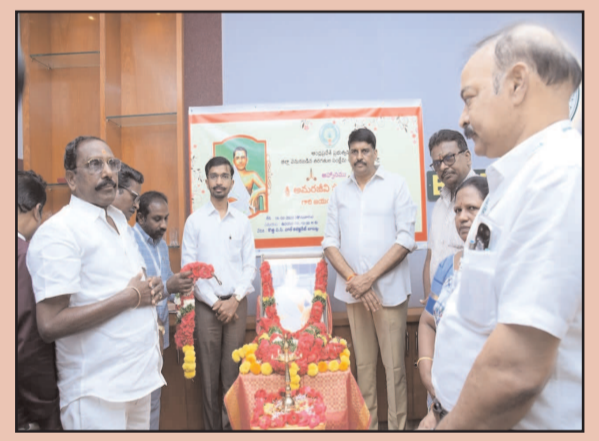
(షణ్ముఖ వెలుగు, బాపట్ల, మార్చి 16)