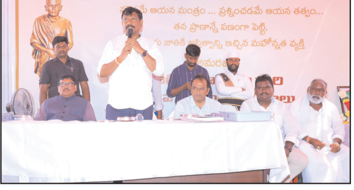
(షణ్ముఖ వెలుగు స్టాఫ్ రిపోర్టర్, మార్కాపురం, మార్చి 16)