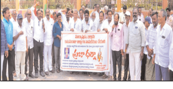
(షణ్ముఖ వెలుగు, ఒంగోలు, మార్చి 16)