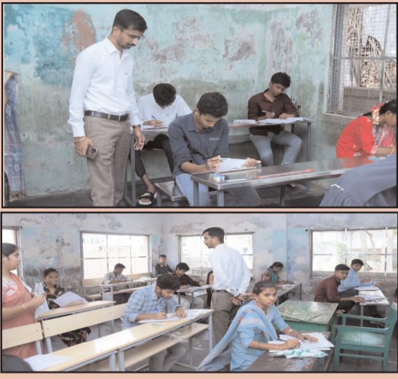
(షణ్ముఖ వెలుగు, బాపట్ల, మార్చి 16)