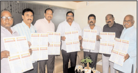
(షణ్ముఖ వెలుగు, ఒంగోలు, మార్చి 16)