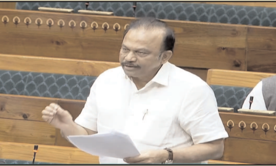
(షణ్ముఖ వెలుగు, ఒంగోలు, మార్చి 16)

పార్లమెంటు సమావేశాలలో ఒంగోలు పార్లమెంటు సభ్యులు మాగుంట శ్రీనివాసులరెడ్డి ఆంధ్రప్రదేశ్ రాష్ట్రంలో నైపుణ్య శిక్షణా కేంద్రం ఏర్పాటు పై మాట్లాడుతూ ఆంధ్రప్రదేశ్ ముఖ్యమంత్రి, నారా చంద్రబాబు నాయుడు, ఐటీ శాఖ మంత్రి నారా లోకేశ్ నాయకత్వంలో రాష్ట్రం అవారంగా అభివృద్ధి చెందుతుందని, ముఖ్యంగా కృత్రిమ మేధస్సు, క్యాంటం కంప్యూటింగ్, డ్రోన్లు మరియు పునరుత్పాదక శక్తి వంటి సాంకేతిక రంగాలలో ఆంధ్రప్రదేశ్ త్రాప్రంలో బాగా అవకాశాలు వున్నాయన్నారు. ఈ అవకాశాల సద్వినియోగానికి, యువతకు సాధికారత కల్పించుటకు ఆంధ్రప్రదేశ్ రాజధాని అమరావతిలో నైపుణ్య శిక్షణా కేంద్రాన్ని ఏర్పాటు చేయాలని కోరారు. దానికి కేంద్ర నైపుణ్యభివృద్ధి, వ్యవస్థాపకత శాఖ (స్వతంత్ర) సహాయక మంత్రి, జయంత్ చౌదరి సమాధానమిస్తూ ఆంధ్రప్రదేశ్ ముఖ్యమంత్రి నారా చంద్రబాబు నాయుడు రాష్ట్రంలో యువతకు మెరుగైన నైపుణ్యాలను అందించడానికి ప్రత్యేకంగా కృషిచేస్తున్నారని చెప్పారు. ప్రధానమంత్రి సేతు పథకం క్రింద రూ.60,000 కోట్లతో దేశ వ్యాప్తంగా ఇదు నైపుణ్య శిక్షణా కేంద్రాలను ఏర్పాటు చేయబడుతున్న తెలిపారు. ఆంధ్రప్రదేశ్లో సూతన నైపుణ్య శిక్షణా కేంద్రం ఏర్పాటుకు భూమిని కూడా రాష్ట్రం కేటాయించిందని, ఈ కేంద్రం పరిధిలోకి ఆంధ్రప్రదేశ్లో పాటు తెలంగాణ రాష్ట్రం కూడా వస్తుందని కేంద్ర మంత్రి మాగుంట శ్రీనివాసులరెడ్డికి తెలియజేశారు.