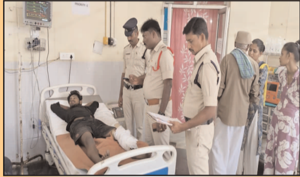
(షణ్ముఖ వెలుగు, ఉలపాడు, మార్చి 11)