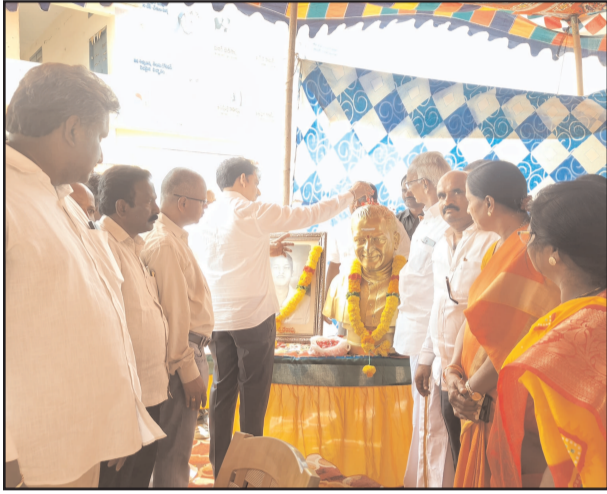
(షణ్ముఖ వెలుగు, చిన్నగంజాం, మార్చి 08)

500 మందికి పరీక్షలు, 150 మందికి శస్త్రచికిత్సలు ఆప్యాయంగా పలకరిస్తూ ఆరోగ్య పరిస్థితి తెలుసుకున్న ఎమ్మెల్యే సాంబన్న శిబిరాలు నిరంతరం ఉచిత కంటి వైద్య శిబిరాలు లక్ష మందికి ఉచిత కంటి శస్త్ర చికిత్సలే లక్ష్యం పేదల ఆరోగ్య వరప్రదాయని సీఎంఆర్ఎఫ్ కంటి వైద్య శిబిరంలో ఎమ్మెల్యే ఏలూరి