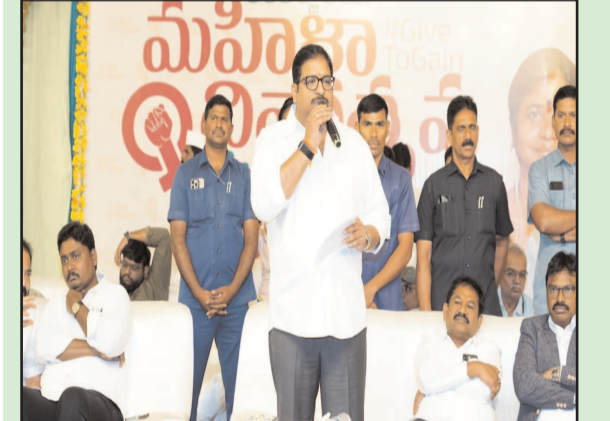
(షణ్ముఖ వెలుగు, ఒంగోలు, మార్చి 08)