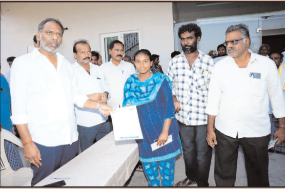
(షణ్ముఖ వెలుగు, అద్దంకి, మార్చి 08)