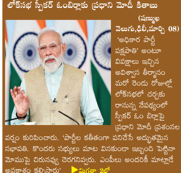
వర్షం కురిపించారు. 'సార్వీల కఠితంగా పనిచేసే అద్భుతమైన సభాపతి. కొందరు సభ్యులు మాట వినకుండా ఇబ్బంది పెట్టినా మోముపై చిరునవ్వు చెరగనివ్వరు. ఎంపీలు అందరికీ మాట్లాడే అవకాశం కల్పిస్తారు'