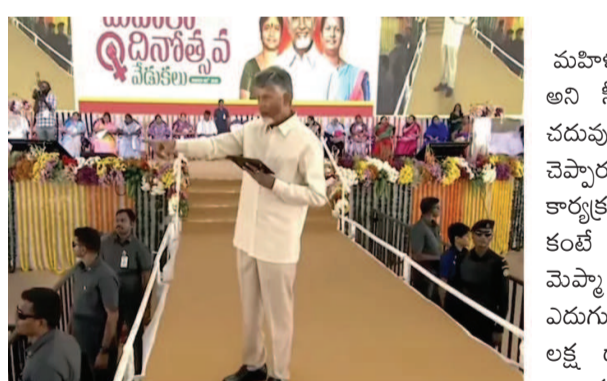
తలపెట్టినా.. సాధించే వరకు వదలరు. అప్పులు ఇప్పించే బాధ్యత నాది.. సద్వినియోగం