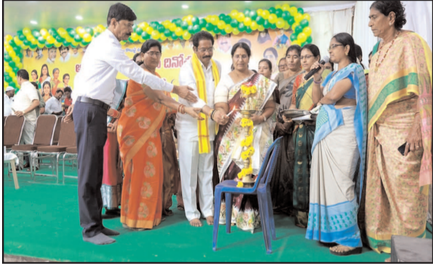
(షణ్ముఖ వెలుగు, వినుకొండ, మార్చి 08)