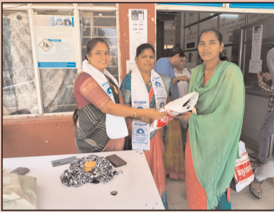
(షణ్ముఖ వెలుగు, మార్కాపురం టౌన్, మార్చి 08)

అంతర్జాతీయ మహిళా దినోత్సవం సందర్భంగా మార్కాపురం పట్టణంలో హృదయాన్ని హత్తుకునే సేవా కార్యక్రమం నిర్వహించబడింది. ఆదివారం మార్కాపురం ఏరియా ప్రభుత్వ ఆసుపత్రిలో మానవతా సేవా సంస్థ ఆధ్వర్యంలో ఆసుపత్రి పరిశుభ్రత కోసం నిత్యం శ్రమిస్తున్న మహిళా శానిటరీ సిబ్బందికి చీరలు పంపిణీ చేసి ఘనంగా సత్కరించారు. సమాజ ఆరోగ్యానికి కీలకమైన పరిశుభ్రత బాధ్యతలను నిర్వహిస్తున్న ఈ మహిళల సేవలను గుర్తించి వారికి గౌరవం తెలియజేయడం కార్యక్రమం ప్రత్యేకతగా నిలిచింది.