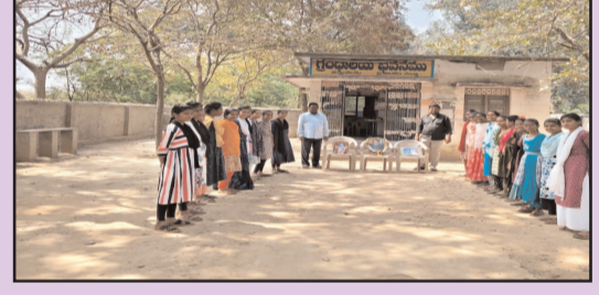
(షణ్ముఖ వెలుగు, తర్లపాడు, మార్చి 08)