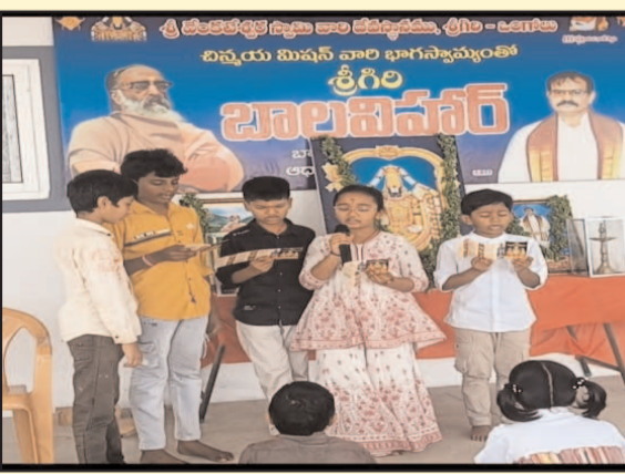
(షణ్ముఖ వెలుగు, ఒంగోలు, మార్చి 08)

చిన్నారులను తగిన విధంగా ప్రోత్సహిస్తూ వారిలోని సృజనాత్మక నైపుణ్యాలను వెలికి తీస్తూ వారు దేశం, ప్రపంచం మెచ్చుకునే మేధావులుగా గొప్ప ఆలోచనాశీలురుగా మేటి వక్తలుగా రూపొందుతారని శ్రీగిరి బాల విహార్ విద్యార్థులు రుజువు చేస్తున్నారు.