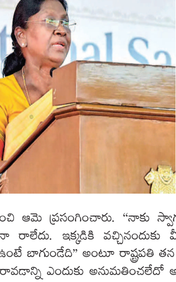
ప్రాటోకాల్ను పట్టించుకోని మమత సర్కారు విమానాశ్రయానికి రాని ముఖ్యమంత్రి, మంత్రులు ముర్ము అసహనం.. నివేదిక సమర్పించాలని ఆదేశం

(షణ్ముఖ వెలుగు, ఢిల్లీ, మార్చి 08) రాష్ట్రపతి ద్రౌపది ముర్ముకు పశ్చిమ బెంగాల్లో చేదు అనుభవం ఎదురైంది. శనివారం ఆమె పాల్గొన్న 9వ అంతర్జాతీయ సంతాల్ సదస్సుకు ప్రభుత్వం అనుమతి నిరాకరించడంతో చివరిక్షణంలో వేరేచోటుకు దానిని మార్చాల్సి వచ్చింది. దాంతో ప్రతినిధులు అతికొద్ది సంఖ్యలోనే అక్కడకు చేరుకున్నారు. ప్రాటోకాల్ ప్రకారం తనను స్వాగతించడానికి ముఖ్యమంత్రి, మంత్రులు రావాల్సి ఉండగా ఒకేఒక్క మేయర్ను పంపడంపై ముర్ము అసహనం వ్యక్తం చేశారు. ఈ వ్యవహారంపై నివేదిక పంపాలని ప్రభుత్వాన్ని ఆదేశించారు. బాగ్డోగ్రా విమానాశ్రయం సమీపంలో ఆదివాసీ సదస్సును ఉద్దేశించి ఆమె ప్రసంగించారు. "నాకు స్వాగతం వలకదానికి ముఖ్యమంత్రి రావాలి. కానీ రాలేదు. గవర్నర్ బదిలీ అయినందువల్ల ఆయనా రాలేదు. ఇక్కడికి వచ్చినందుకు మీకు (ప్రతినిధులకు) ధన్యవాదాలు. ముందు అనుకున్నట్లు బిధాన్సంగర్లో కార్యక్రమం జరిగితే బాగుండేది" అంటూ రాష్ట్రపతి తన ప్రసంగాన్ని ప్రారంభించారు. "మమత నా చెల్లిలాంటివారు. నేనూ బెంగాల్ ప్రతినిధి. మరీ నేను రావడాన్ని ఎందుకు అనుమతించలేదో అర్థం కావట్లేదు" అని రాష్ట్రపతి పేర్కొన్నారు.