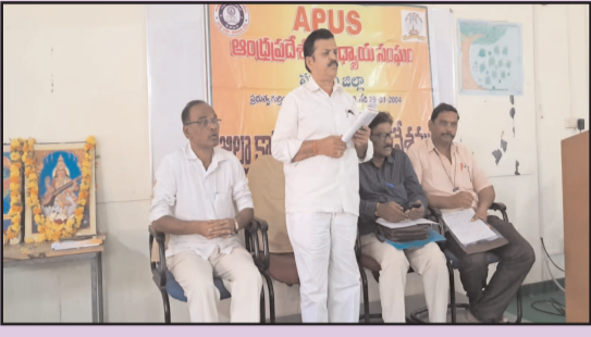
(షణ్ముఖ వెలుగు, ఒంగోలు, మార్చి 08)