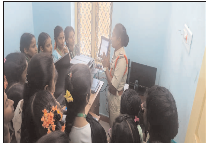
(షణ్ముఖ వెలుగు స్టాఫ్ రిపోర్టర్, మార్కాపురం, మార్చి 06)