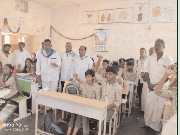
(షణ్ముఖ వెలుగు, హనుమంతునిపాడు, మార్చి 06)