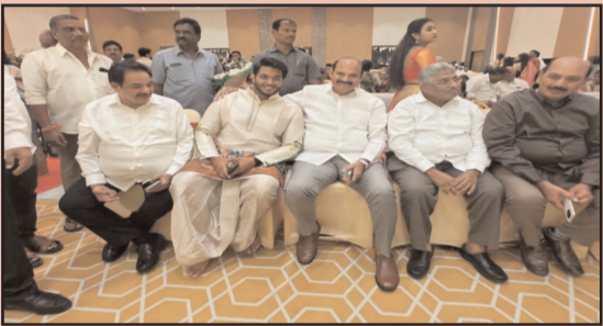
(షణ్ముఖ వెలుగు, కనిగిరి టౌన్, మార్చి 06)