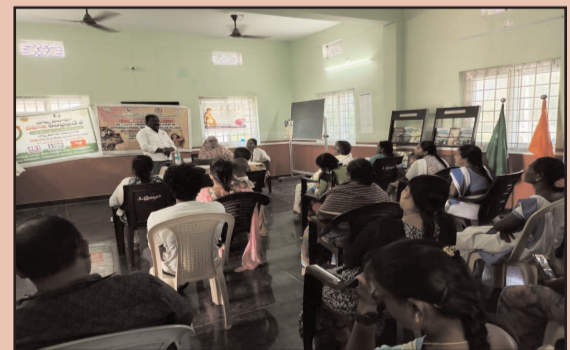
(షణ్ముఖ వెలుగు, పొన్నలూరు, మార్చి 06)