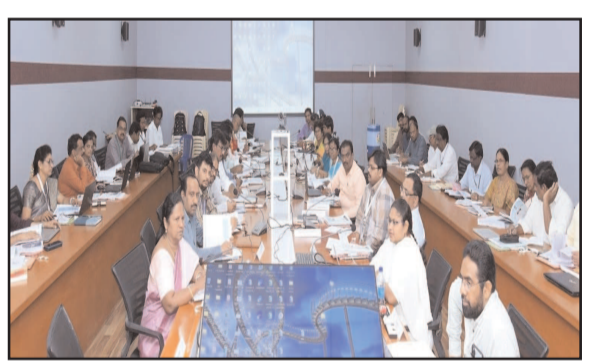
(షణ్ముఖ వెలుగు, బాపట్ల, మార్చి 06)

జనగణన నిర్వహణకు అధికారులు సిద్ధం కావాలని జిల్లా సంయుక్త కలెక్టర్ భావన వశిష్ట తెలిపారు. జనగణన-2026 నిర్వహణపై ఆర్డీవోలు, తహసీల్దార్లు, ఎండిఓలకు మూడు రోజుల శిక్షణ కార్యక్రమం శుక్రవారం స్థానిక కలెక్టర్ లో ప్రారంభమైంది. జనగణన పక్కా ఉండాలంటే అధికారులు నిబద్ధతతో పనిచేయాలని జిల్లా సంయుక్త కలెక్టర్ చెప్పారు. మే నెల నుంచి జనగణన మొదలుకానుందన్నారు. జనగణన కార్యక్రమం జిల్లాలో సమర్థంగా నిర్వహించడానికి 13 మంది జిల్లా అధికారులను కమిటీగా నియమించామన్నారు. తొలి విడతలో ఆర్డీవోలు, మునిసిపల్ కమిషనర్లు, తహసీల్దార్లు, ఎండిఓలకు శిక్షణ ఇస్తున్నామన్నారు. ఇదే క్రమంలో ఉపతహసీల్దార్లు, సహాయ గణాంకాల అధికారులు, సీనియర్ సహాయకులకు శిక్షణ ఇస్తున్నట్లు చెప్పారు. జనగణన ప్రక్రియ మే నెల ఒకటి నుంచి ప్రారంభించేందుకు కేంద్ర, రాష్ట్ర ప్రభుత్వాలు సంయుక్తంగా చర్యలు తీసుకుంటున్నాయని జనగణన సంయుక్త సంచాలకులు ప్రసన్న కుమార్ చెప్పారు. జనగణన ప్రక్రియ డిజిటల్ విధానంలో జరుగుతుందన్నారు. క్షేత్రస్థాయిలో సచివాలయాల సిబ్బంది జన గణనలో పాల్గొంటారన్నారు. డిజిటల్ విధానంలో చేపట్టే జనగణన పక్కా ఉండాలన్నారు. ఇందుకోరకే ప్రభుత్వం అత్యధిక సాంకేతిక పరిజ్ఞానాన్ని అందుబాటులోకి తెచ్చిందన్నారు. జనగణన కొరకు ప్రత్యేక యాప్ లను ప్రవేశపెడుతుందన్నారు. భవనాలను గుర్తించడం, భవనాలకు సంఖ్య కేటాయింపడం, యాప్ ల ద్వారా వివరాలను నిక్షిప్తం చేయాలి ఉంటుందని వివరించారు. ఈ కార్యక్రమంలో డిఆర్.ఓ జి గంగాధర్ గౌడ్, ఆర్డీవోలు, తహసీల్దార్లు, ఎండిఓలు, తదితరులు పాల్గొన్నారు.