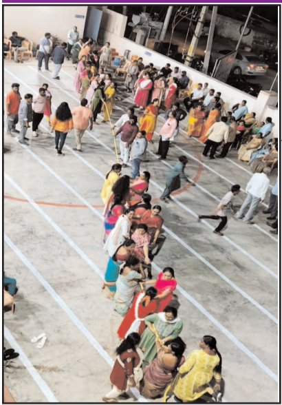
(షణ్ముఖ వెలుగు, ఒంగోలు, మార్చి 06) రెండవ రోజు ఉత్సాహంగా ఆంధ్రప్రదేశ్ నాన్ గెజిటెడ్, గెజిటెడ్ ఆఫీసర్స్ అసోసియేషన్ (మహిళా విభాగం)లో క్రీడలు సాగాయి. ఎపియన్ జిఓ అసోసియేషన్