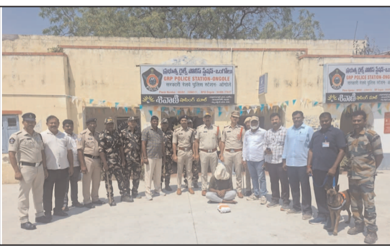
(షణ్ముఖ వెలుగు, ఓంగోలు, మార్చి 06)