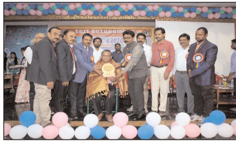
(షణ్ముఖ వెలుగు స్టాఫ్ రిపోర్టర్, మార్కాపురం, మార్చి 06)