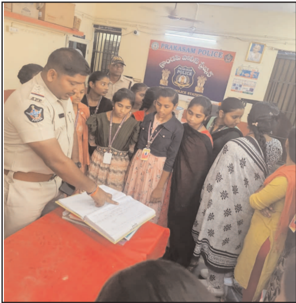
(షణ్ముఖ వెలుగు, ఒంగోలు, మార్చి 06)